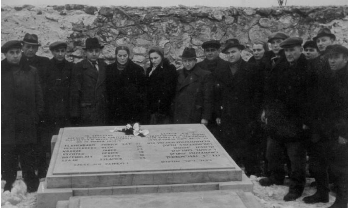
צ'נסטוחובה 1946 – טקס אזכרה לששת הפרטיזנים

התאחדות יוצאי מחוז צ'נסטוחובה (דור ההמשך ער) בישראל Association of Częstochowa District Jews in Israel ת.ד. 65050 תל אביב 61650 – טל: 03-6749322 – P.O.B 65050 Tel Aviv E mail: czestochowajewsinisrael@gmail.com