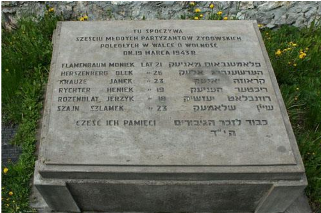
מראה הקבר לפני שנים רבות, כיום בחלקו קשה לקריאה