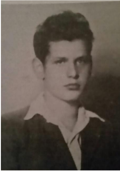
שלמעק שיין

התאחדות יוצאי מחוז צ'נסטוחוב (דור ההמשך ער) בישראל Association of Częstochowa District Jews in Israel ת.ד 65050 תל אביב 61650 – טל: 03-6749322 – P.O.B 65050 Tel Aviv 61650 E mail: czestochowajewsinisrael@gmail.com